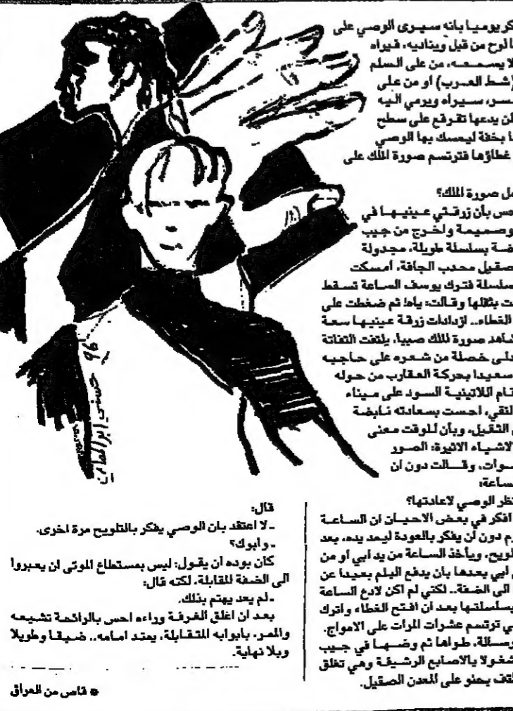
قاله - لا اعتقد بان الوصي يذكر بالنيح مرة اخرى

في لا يتألم على اعتبار انتقاري لها جارة، وحينما في عهده الهالي تبقى له تلك الذكرى من زمن ما افتتقنا بلا عود هي ان نسال ان عيش، سواء سواء ولكن تلك الذكرى ان تقول لها الحق حقاً ولا ترتد يا صاحبي قلبها الفراع الان متى ودعي الفتي كما تشتهي.